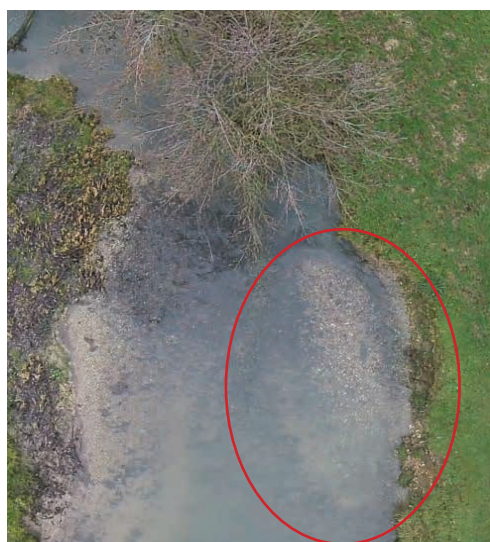
Frayère de Grands Salmonidés migrateurs observée sur la Créquoise

La majorité des saumons va mourir après reproduction, alors qu'une part non négligeable des truites de mer va survivre et redévaler en mer afin d'accomplir un nouveau cycle (réalimentation et grossissement en mer puis nouvelle migration en eau douce à partir du printemps).