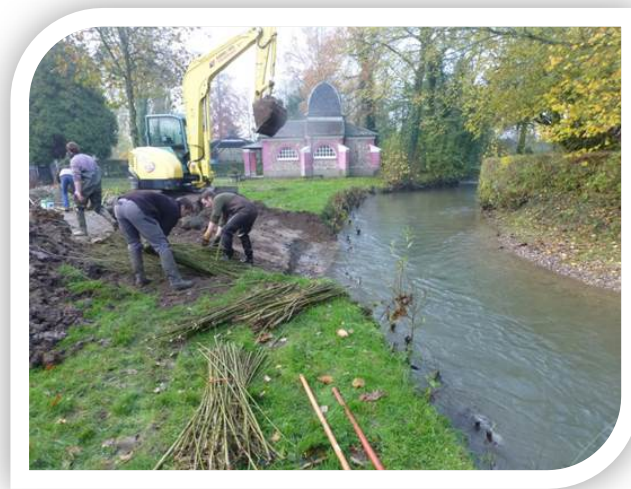
Réalisation de la fascine de Saules