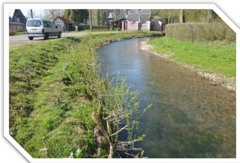
Etat final après travaux