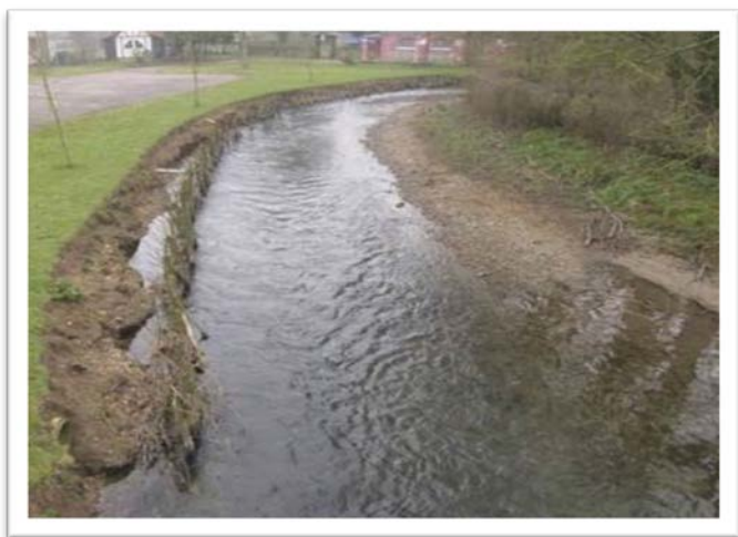
Etat initial avant travaux