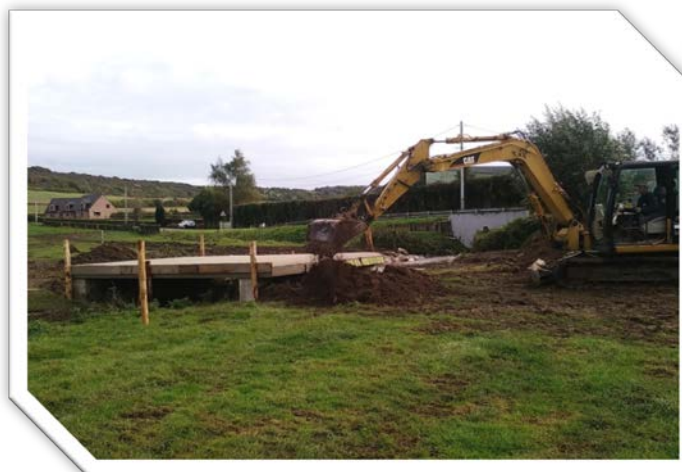
Création de passerelles