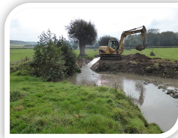
Arasement et équipement des ouvrages