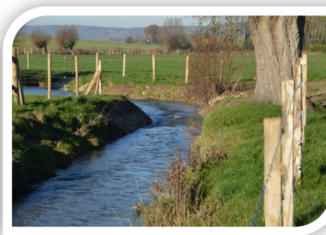
Mise en place de clôtures, d'abreuvoirs et de pompes à museau