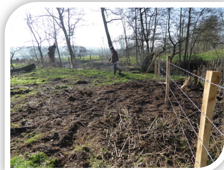
Mise en place des clôtures