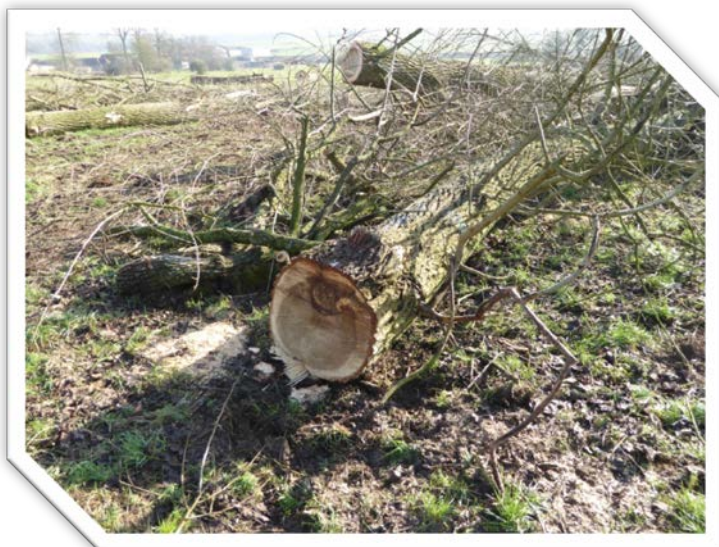
Abattage des peupliers