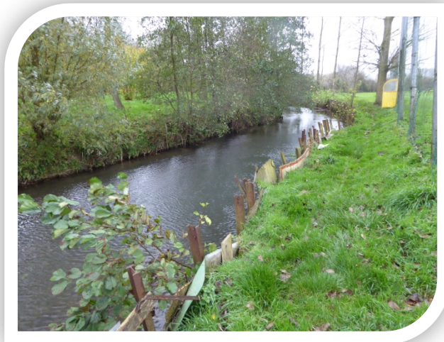
Anciennes protections de berges inefficaces