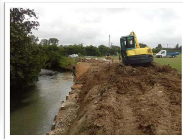
Réalisation de l'ouvrage de la fascine de saules