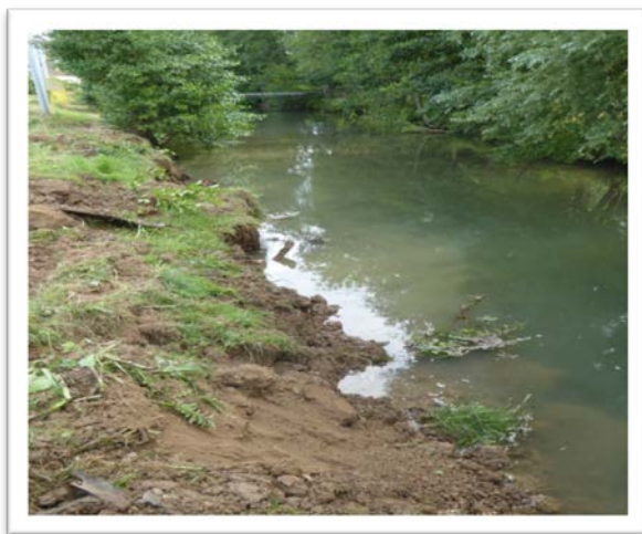
Etat initial, dégradation des berges par les bovins